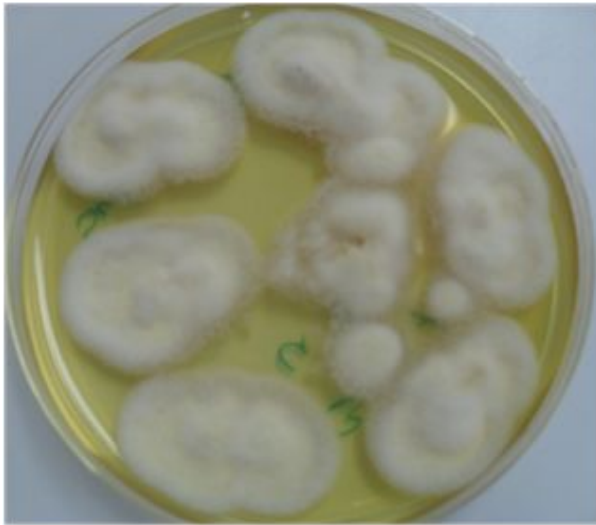
Figura 4: Segunda muestra subcultivada en Agar papa, 7 días de crecimiento, colonias crema-amarilla