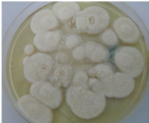
Figura 2: Colonias en SBC de 7 días de incubación a 28 ° C.

Se inocularon por duplicado cajas de Petri conteniendo medio de Sabouraud cloranfenicol (SBC), con un mínimo de diez escamas procedentes de la muestra obtenida de la uña de la paciente. Todas las muestras así sembradas se incubaron a 28 °C y revisadas cada 48 horas en busca de crecimiento. Al 4to. día se observó el crecimiento de colonias ligeramente amarillo a crema pálido, hasta su madurez al 7° día con micelio granular ligeramente radiado y reverso amarillo pálido (Figura 2.)