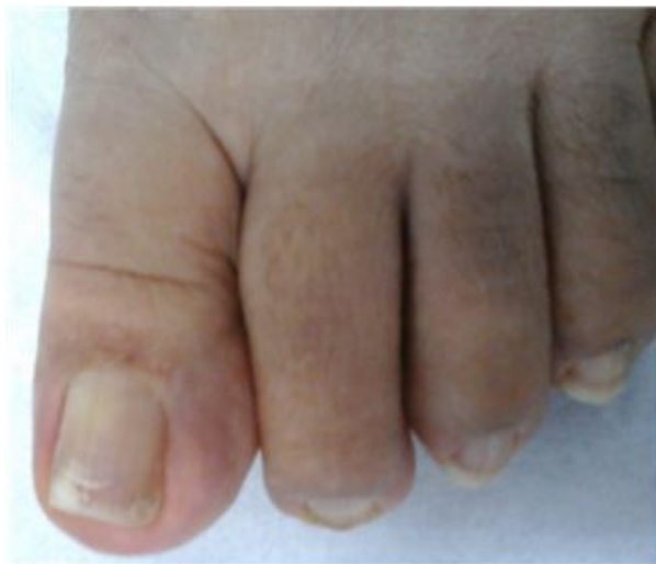
Figura 1: Uña con manchas blancas (semejando tizas), opacas, sobre la superficie de la lámina dorsal ungueal del dedo mayor del pie izquierdo.

Paciente femenina de 47 años de edad, procedente de un área rural de la República Dominicana y actualmente residente en la ciudad de Santo Domingo, con alteraciones de la uña del dedo mayor del pie izquierdo porción distal, de cinco años de evolución. Las lesiones que consistían en manchas blancas (semejando tizas), opacas, sobre la superficie de la lámina dorsal ungueal con ligero opacidad en la lámina ungueal (Figura 1), la cual había sido tratada con diferentes antifúngicos sin mejoría. La paciente no refirió antecedentes clínico-patológicos de importancia ni antecedentes de visitas recientes a zonas rurales.