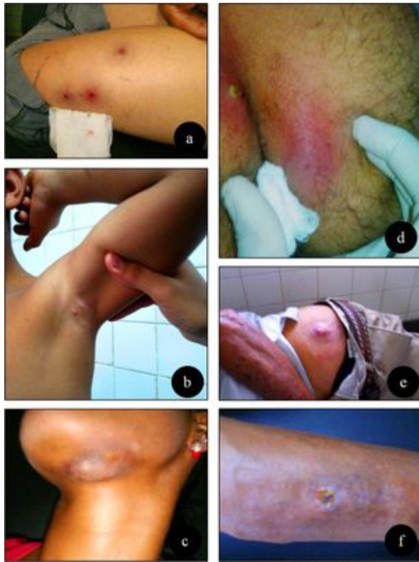
Figura 2. Lesiones representativas en algunos de los pacientes estudiados.

El promedio de edad de los pacientes fue 32,33 años, con un rango de 68 años (1 - 69); de ellos el 61,10% (n=11) tenían entre 18 y 64 años, siendo las edades extremas la población minoritaria en este estudio. En cuanto al sexo, el 66,7% (n=12) de los pacientes eran del sexo femenino, lo que se traduce a una relación 2:1 con respecto al sexo masculino para esta serie de casos. Del mismo modo, se clasificaron de acuerdo a su procedencia los 18 pacientes en estudio, de los cuales 22,20% (n=4) provenían del sector las Mercedes; 16,70% (n=3) sector Centro y Francisco de Miranda, respectivamente; 11,10% (n=2) sector Aguirre, El bambú y José Andrés Castillo, respectivamente; y 5,55% (n=1) del sector La Cruz y Cerro El Peñón, respectivamente.