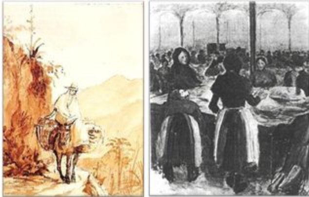
Der: Vendedora del mercado en viaje hacia Caracas. Camille Pissarro Acuarela en sepia y lápiz sobre papel. A los 22 años. Izq: "El Puesto del Mercado" C. Pissarro 1890 A los 60 años.

Curiosamente el finca donde se hallaba situada la casa donde tuvieron lugar las primeras sesiones de la Sociedad Patriótica de Venezuela en 1809 y 1810 estaba situada cerca de puente de Doña Romualda en la esquina del mismo nombre en Caracas, Venezuela. Pues bien Camille Pissarro hizo un dibujo del puente.