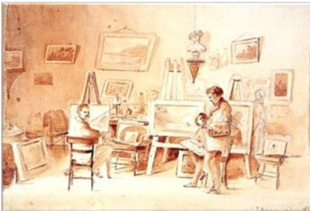
"Estudio del Artista en Caracas"™ Camille Pissarro 1854. Acuarela en sepia, lápiz y tinta negra sobre papel" 26,6 x 36,7 cm. Aparecen Pissarro y Melbye.