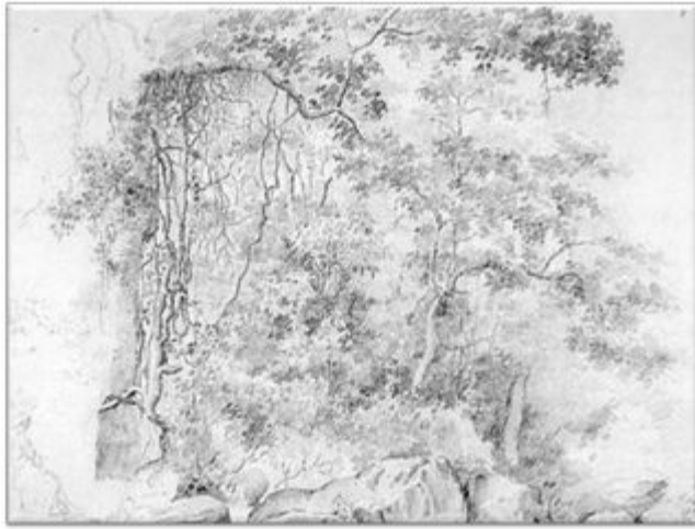
"Rocas y selva tropical con figura sentada" Camille Pissarro 1852 " 1854 Lápiz sobre papel