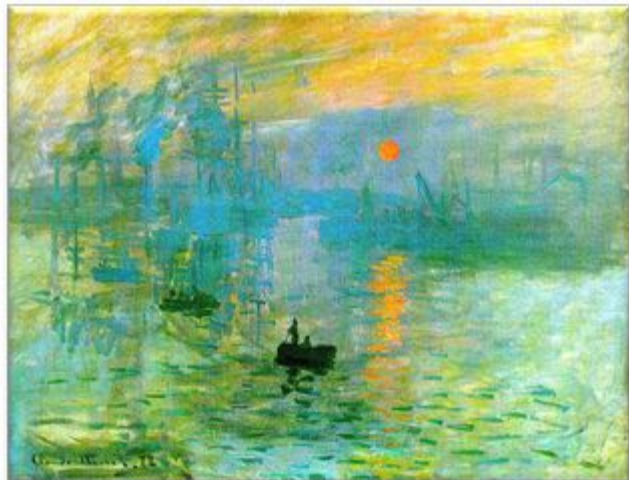
Monet "Impresión al Amanecer"™, 1872 Museo Marmottan Monet, Paris.

«Impresionismo», creada con intención peyorativa por el crítico Leroy. Esta primera muestra fue el punto de llegada de un período de formación iniciado quince años antes por un grupo de artistas de la Academia Suisse (Pissarro, Cézanne, Guillaumin, Monet, Renoir, Sisley, Bazille), quienes, interesados en romper con los planteamientos pictóricos tradicionales y a partir de las innovaciones de Corot y de los paisajistas de la escuela de Barbizon- Fontainbleau, se centraron en la pintura al aire libre y buscaron el plasmado cambiante de la luminosidad de los paisajes y de las figuras humanas.