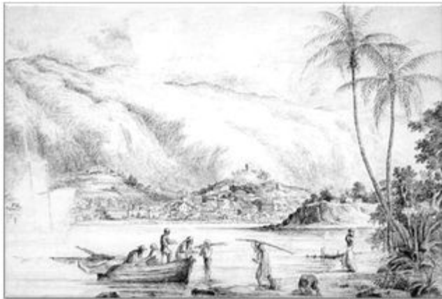
"Escena del puerto, paisaje y figuras" Camille Pissarro 1852 - 1854. Plumilla y lápiz sobre papel 35 x 51,5 cm