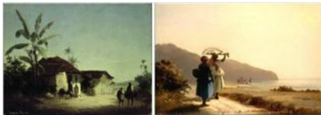
Der.: "Paisaje con cabañas y palmeras tropicales"™. Camille Pissarro 1856 Izq.: "Dos mujeres charlando junto al mar" Saint Thomas. Camille Pissarro 1856

Corría el año 1856 y en París se recuerda de la geografía caribeña de su juventud, que tanto le serviría para sus paisajes en la Francia rural por más de 50 años.