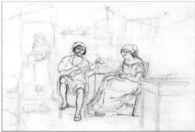
"Serenata" Camille Pissarro 1852 - 1854". Plumilla y lápiz sobre papel" 38 x 27,2 cm