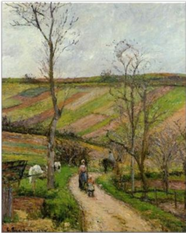
"Route du Fond de l'Hermitage", Pontoise. Camille Pissarro 1877

Otra muestra de lo que hizo Pissarro en Venezuela, lo vemos en escenas costumbristas, muy características de Pissarro en su época impresionista francesa de la segunda mitad del siglo XIX.