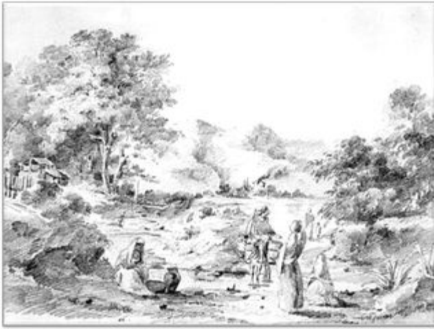
"A orillas del arroyo" Camille Pissarro 1852 " 1854. Lápiz sobre papel.