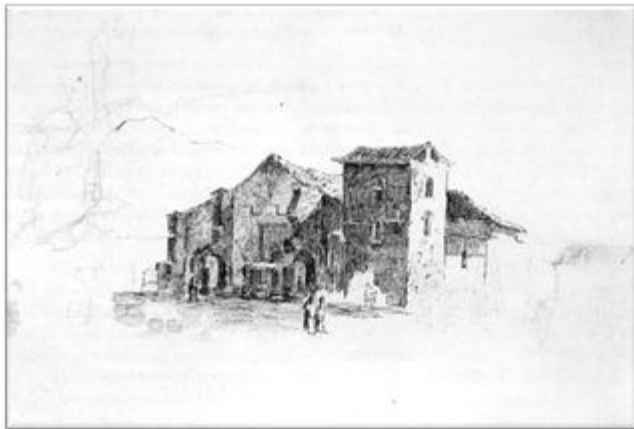
"La iglesia de la Candelaria" Camille Pissarro. 1854 Plumilla y lápiz sobre papel 17,6 x 26,5 cm