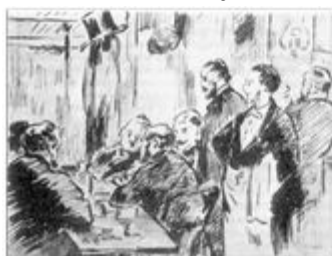
Manet 1869. La Tertulia del Café 'Guerbois' en el Boulevard de Batignolles

Se reunían en el Café Guerbois en el Boulevard de Batignolles y posteriormente en el Café La Nouvelle-Athènes en la rue Pigalle en Montmartre. Abajo lo vemos en un grafico a creyón de Manet de 1869 y en una foto de la época.