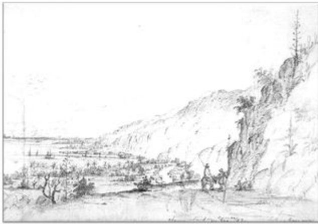
"Camino nuevo hacia Caracas" Camille Pissarro 1852. Plumilla y lápiz sobre papel 23 x 33,5 cm