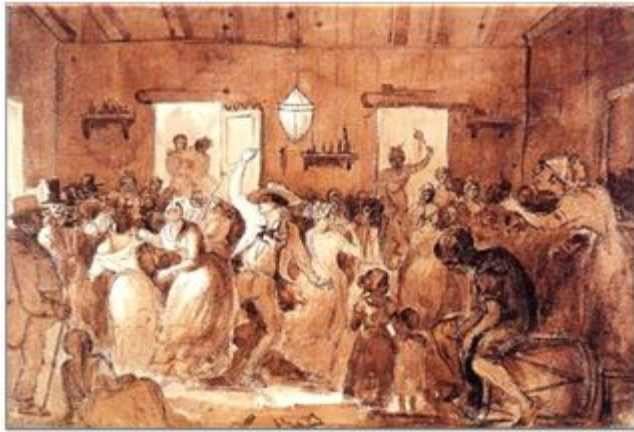
"Baile en la posada" Camille Pissarro 1852 " 1854. Acuarela en sepia sobre papel 36,4 x 53 cm.