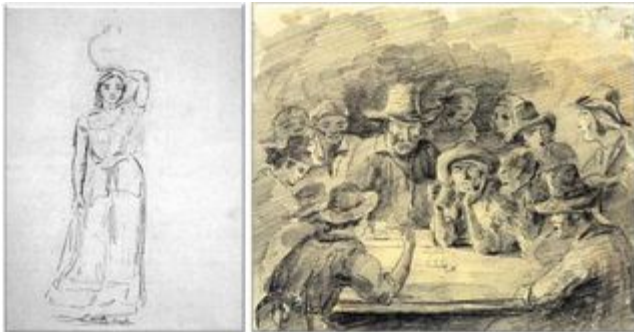
Der: "Estudio de aguadora" Camille Pissarro. 1852 - 1854 Lápiz sobre papel. Izq: "Jugadores de Naipes" C. Pissarro. 1854. Lápiz sobre papel