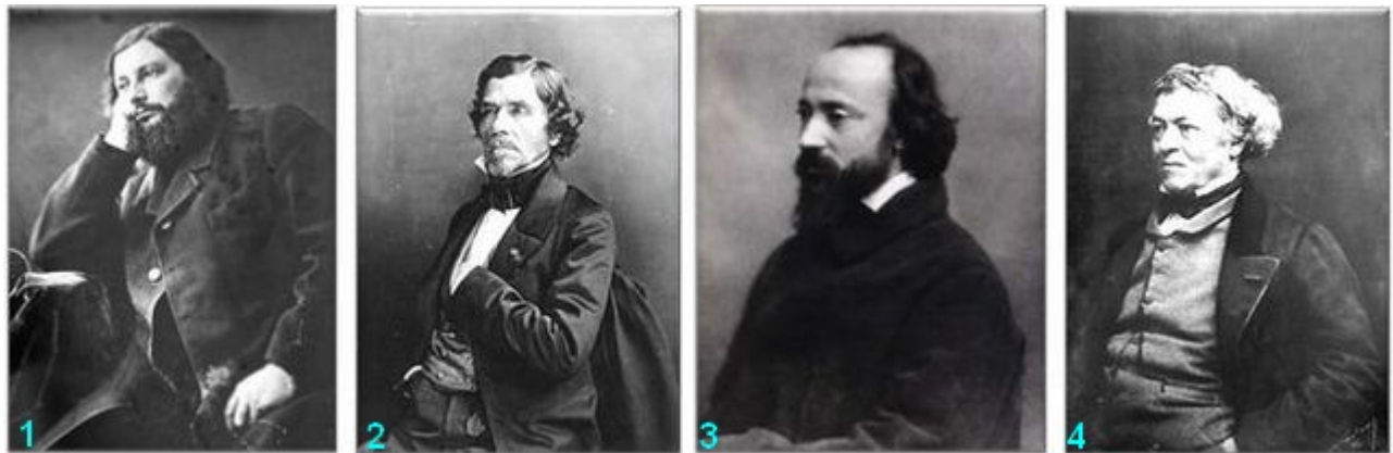
1-Gustave Courbet 2-Eugene Delacroix 3- Charles Francois Daubigny 4-Jean-Baptiste Camille Corot

Al llegar a Francia Camille Pissarro tuvo cuatro grandes pintores que lo orientan y de los cuales Pissarro toma muchos detalles, más nunca recibiría clases de ellos. Abajo los vemos en fotos de Gaspard-Felix Tournachon llamado "Nadar"™. Son Courbet, Delacroix, Daubigny y Corot.