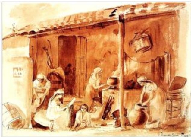
"Cocina al aire libre" Camille Pissarro 1854. Acuarela en sepia, lápiz y tinta negra sobre papel 26,6 x 36,7 cm.