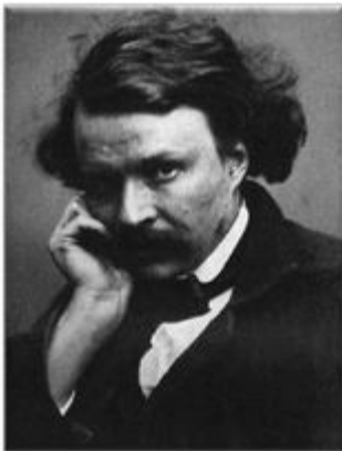
Gaspard-Felix Tournachon "Nadar" (1820-1910)

Camille Pissarro fue el menos espectacular de los impresionistas porque fu  un pintor m s tonal que esencialmente colorista. Pero, Decano del Impresionismo, tuvo un importante papel como conciencia moral y gu a art stico. La primera manifestaci n oficial del impresionismo fue la 1 a exposici n organizada en 1874 en el estudio del fot grafo Nadar, al margen del Sal n oficial, por un grupo de pintores (Bazille, C zanne, Degas, Monet, Morisot, Pissarro, Renoir, Sisley), cuyas obras motivaron el rechazo y la burla generalizada de la cr tica y del p blico.