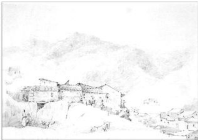
"Camino del Gavilán" Camille Pissarro 1852 " 1854. Lápiz sobre papel 25 x 34,9 cm