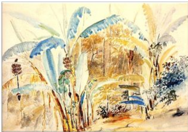
"Bananeros" Camille Pissarro 1852 " 1854. Acuarela y lápiz sobre papel 36,4 x 53 cm.