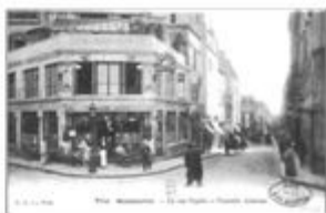
Café La Nouvelle-Athènes 1900