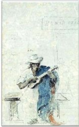
"Tocador de cuatro" Camille Pissarro 1852 - 1854. Acuarela y lápiz sobre papel" 28,5 x 33 cm