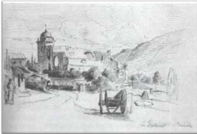
"Vista de La Pastora"™ 1853. Camille Pissarro. Plumilla y lápiz sobre papel" 23 x 33,5 cm

los lugares y por ciertos rasgos costumbristas y en aquéllos el tema verdadero era la luz y la incidencia de las condiciones atmosféricas sobre el paisaje (El período preimpresionista de Pissarro. http://www.lanacion.com.ar/nota.asp?nota_id=184389 )