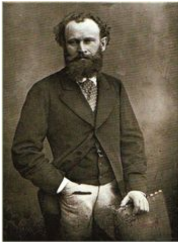
Edouard Manet 1863 'El grande que nunca los apoyó' en la exposición de 1874