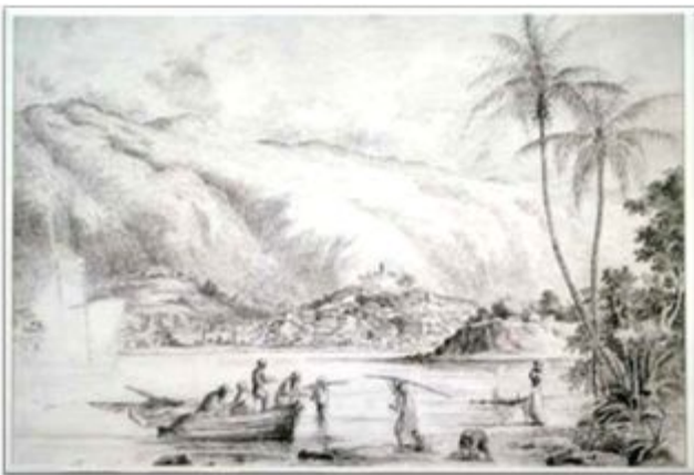
"Escena del puerto, Paisaje y Figuras"™ La Guaira, Venezuela- Camille Pissarro 1852-1854, plumilla y grafito 35. 4 x 51 cm.

Los dibujos y acuarelas que la componen permiten conocer los acentos preimpresionistas de Pissarro, que si bien entonces no se negaba a los escenarios interiores, al uso del negro ni a contornear las figuras para definir sus perfiles, mostraba ya su inclinación por el paisajismo y por las escenas al aire libre, su apego inicial a una pintura inspirada esencialmente por la visión de lo circundante, que incluyó la figura humana y su aspecto social. La diferencia entre esos trabajos y los que se consideran prototipos de su período impresionista propiamente dicho reside en que en éstos el tema es provisto por las circunstancias algo pintoresquistas de