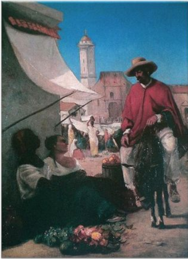
"La Plaza Mayor de Caracas"™ 1852- Camille Pissarro. Oleo sobre tela Colección "Residencia Presidencial La Casona"™