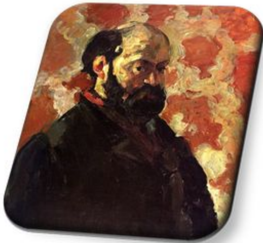
Paul Cezanne por Camille Pissarro.