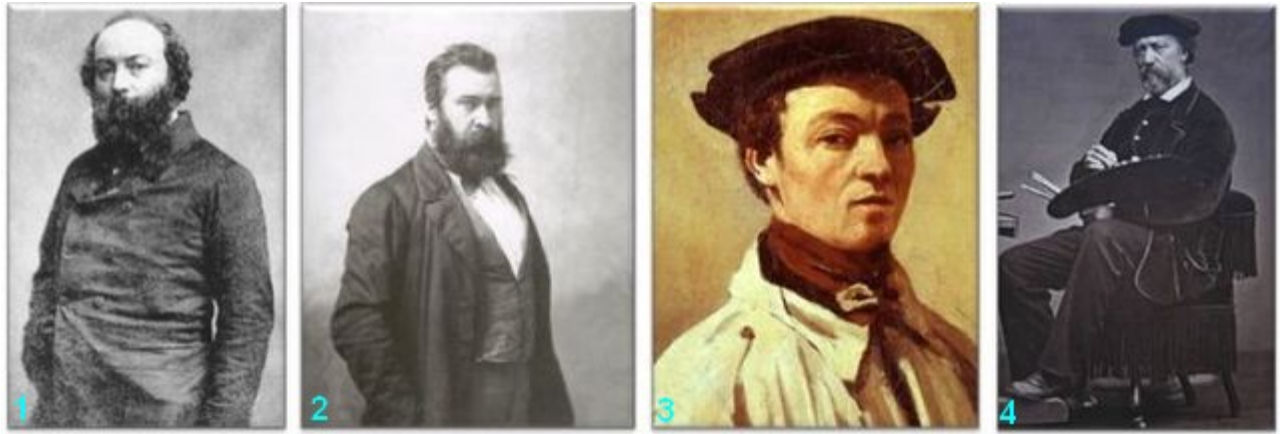
1-Théodore Rousseau 1812-1867, 2- Jean-François Millet 1814-1875, 3- Jean-Baptiste Camille Corot 1796-1875, 4- Charles-François Daubigny 1817-1878