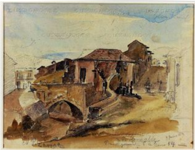
"El Puente de Doña Romualda", Caracas Camille Pissarro 1854. Museo de Bellas Artes, Caracas, Venezuela

Curiosamente el finca donde se hallaba situada la casa donde tuvieron lugar las primeras sesiones de la Sociedad Patriótica de Venezuela en 1809 y 1810 estaba situada cerca de puente de Doña Romualda en la esquina del mismo nombre en Caracas, Venezuela. Pues bien Camille Pissarro hizo un dibujo del puente.