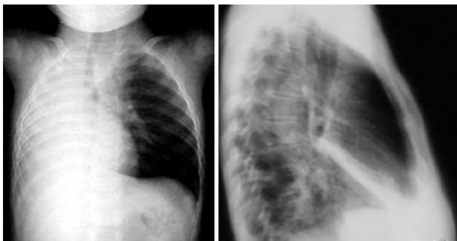
Figura 3. Atelectasias secundarias a broncoaspiración de cuerpo extraño en la vía aérea.

Por último se produce la obstrucción total del paso del aire cuyo resultado será la atelectasia del segmento o del pulmón afecto (Fig.3), seguida de bronconeumonía (muy grave cuando se trata de cuerpos extraños de material orgánico).