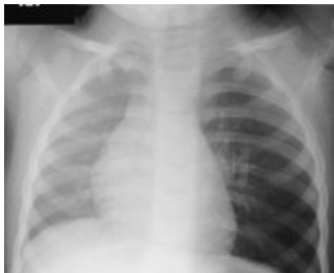
Figura 2. Radiografía en espiración. Evidente hiperlucencia unilateral en el pulmón izquierdo por efecto de válvula y desviación a la derecha del mediastino.

Por último se produce la obstrucción total del paso del aire cuyo resultado será la atelectasia del segmento o del pulmón afecto (Fig.3), seguida de bronconeumonía (muy grave cuando se trata de cuerpos extraños de material orgánico).