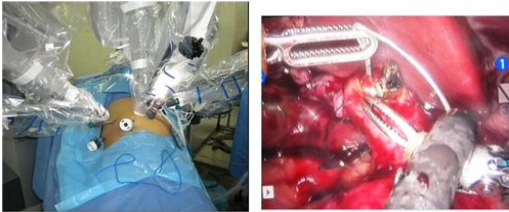
Figura N°4. Exploración laparoscópica de la vía biliar asistida por Robot.

La práctica repetida en el modelo ha permitido un óptimo entrenamiento del equipo quirúrgico, lo cual ha llevado a que en el mes de noviembre de 2009, se haya realizado con éxito la primera exploración laparoscópica de la vía biliar asistida por robot en latinoamérica (Figura N°4).