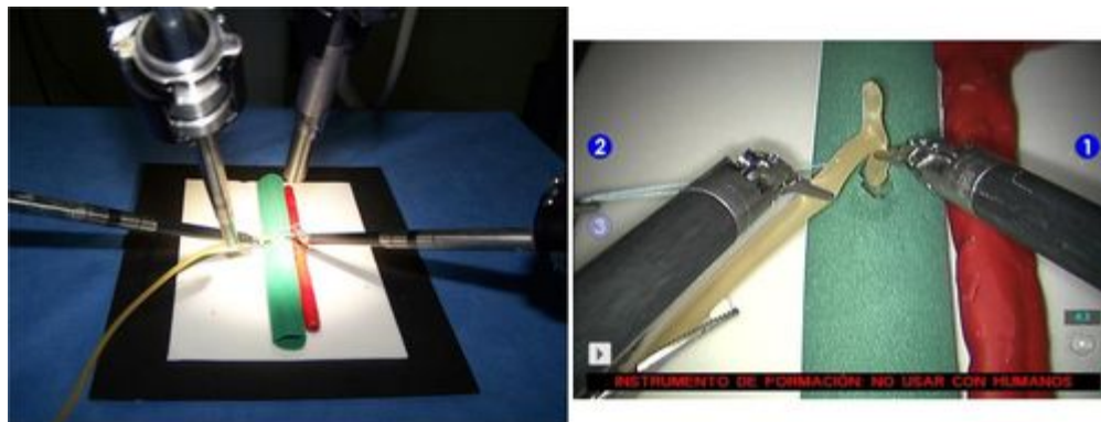
Figura N°3. Colocación del tubo en “t” de Kehr.

Considerado uno de los pasos mas laboriosos de la cirugía, requiere de una práctica adecuada y excelente coordinación de ambas manos, si bien su uso se reserva actualmente para casos seleccionados, es conveniente tener adiestramiento en la colocación del mismo (Figura N°3).